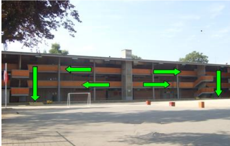
Zona de Seguridad 1 Z-1